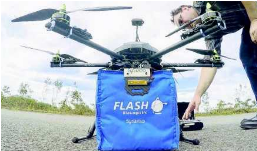
L'utilisation de drones pourrait faire gagner de l'argent et surtout un temps précieux